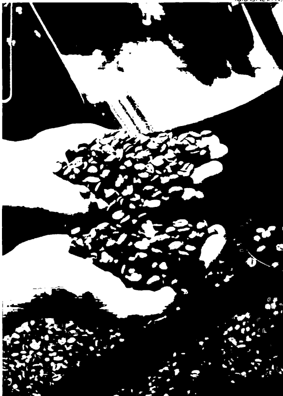
a produção de café robusta enfrenta uma queda, com estimativas de 21,2 milhões de sacas

Essas projeções foram feitas após um extenso levantamento que cobriu cerca de 8 mil quilômetros nas principais regiões produtoras de café, incluindo o Sul da Bahia, Norte e Sul do Espírito Santo, entre outros. O "Giro de Safra" da StoneX foi realizado em cerca de 100 municípios no final de 2023 e início de 2024.